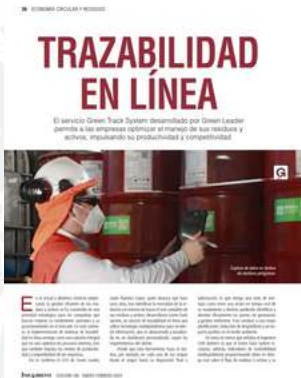
REVISTA INDUAMBIENTE | N° 186 ENERO-FEBRERO 2024