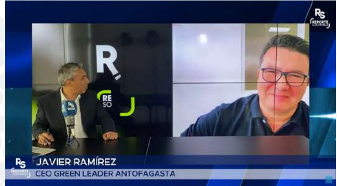
ESPECIAL SOBRE ECONOMÍA CIRCULAR Y RECICLAJE DE REPORTE SOSTENIBLE | ENERO 2024