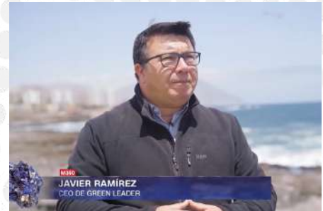
MINERÍA 360 DE CNN CHILE. ECONOMÍA CIRCULAR: RECUPERACIÓN 250 TONELADAS DE RESIDUOS EN SQM | OCT 2022