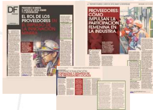
EDICIÓN ESPECIAL 'PROVEEDORES DE LA MINERÍA' DEL DIARIO FINANCIERO | OCT 2022