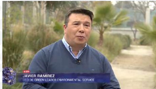
MINERÍA 360 DE CNN CHILE | JUL 2022