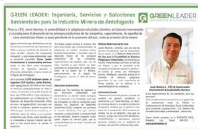
EL MERCURIO DE ANTOFAGASTA | JUN 2022