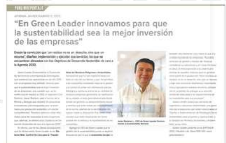
DIARIO FINANCIERO | JUN 2022